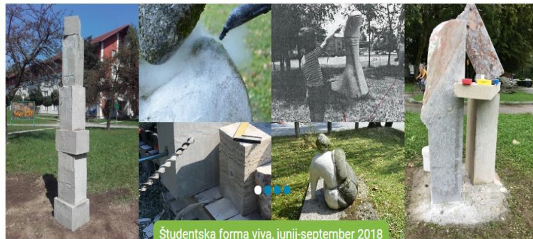
Študentska forma viva, junij-september 2018

DOMOV NAŠI DOMOVI TURIZEM FOREIGN STUDENTS ŠPORT V ŠD KONTAKTI